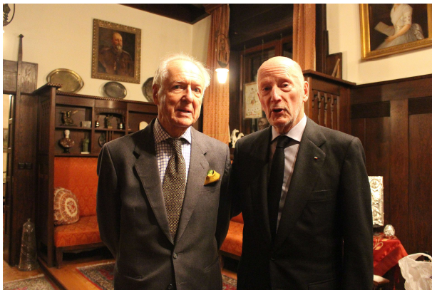
Никита и Симеон II в гостиной охотничьего дома при дворце